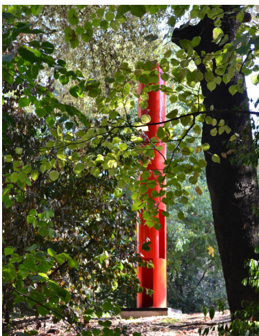
Gottfried HONEGGER Sculpture orange, 2004 Aluminium peint Hauteur 425 cm — Ø 47 cm